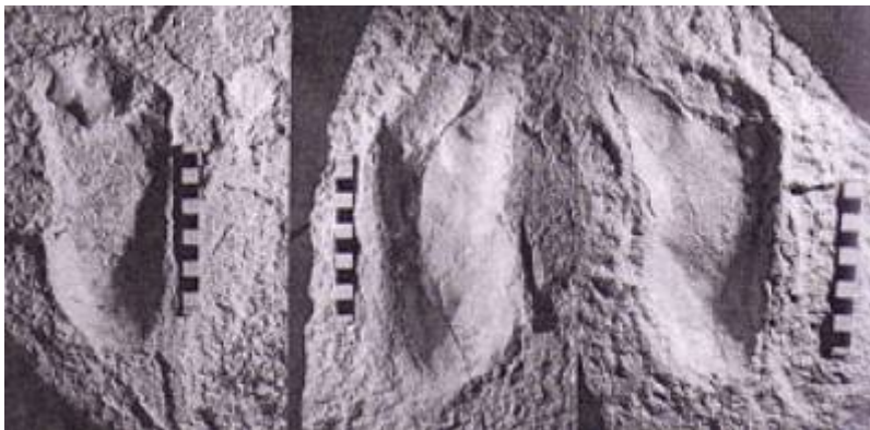
Photographie des empreintes de Laetoli

Autre, exemple, les empreintes de Laetoli , dont certains n'hésitent pas à affirmer qu'elles correspondent exactement aux empreintes d'homme modernes 7) 8) , thèse qui s'effondre devant une simple comparaison :