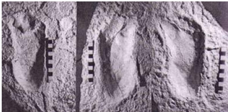
Photographie des empreintes de Laetoli

Autre, exemple, les empreintes de Laetoli , dont certains n'hésitent pas à affirmer qu'elles correspondent exactement aux empreintes d'homme modernes 7) 8) , thèse qui s'effondre devant une simple comparaison :