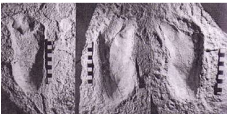
Photographie des empreintes de Laetoli

Autre, exemple, les empreintes de 🦖 Laetoli , dont certains n'hésitent pas à affirmer qu'elles correspondent exactement aux empreintes d'homme modernes 7) 8) , thèse qui s'effondre devant une simple comparaison :