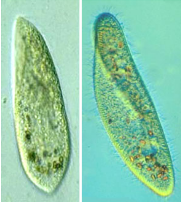
Figure 3.6.1. Paramecium aurelia et Paramecium caudatum.

Paramecium caudatum (à droite) a 45 fois la quantité d'ADN dans son génome de celle de Paramecium aurelia (à gauche). Le génome de Paramecium caudatum est également trois fois plus volumineux que le vôtre (à supposer que vous soyez un être humain).